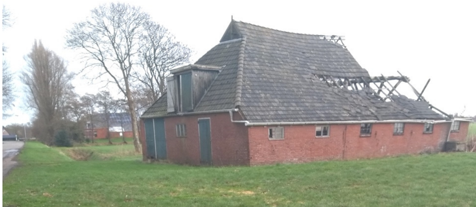
In eintsje de Krite yn, sjogge jo dit bousel (2023)

Wa't Boarnburgum oan de westkant útrydt, de kant fan De Feanhoop op, sjocht al gau oan de linkerkant in restant fan in âlde skuorre stean. En dochs hat it gebouke mei it ynsakke dak ienris minsken húsfeste. De fraach is: Wat is dit foar in púnfal, dat mar hyltyd fierder efterút giet?